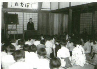
1939年 小阪・延命寺 グリコ 子ども会活動