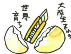
1956年カッターナイフ誕生