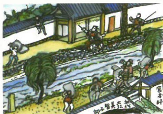
1925年頃 小阪・帝キネ映画撮影風景