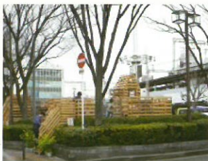
八戸ノ里駅前パレットスクープ (近畿大学・建築学部)