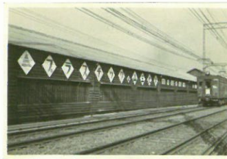
1914年 大軌鉄道・上本町～奈良線開通(写真は1950年代)