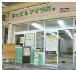
小阪商店街キッズママラボ