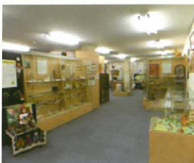
八戸ノ里・宮本順三記念館