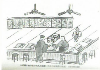
心斎橋呉服店・小大丸