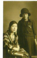
1920年頃、小阪・樟蔭女学生