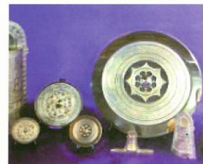
高井田・藤網合金